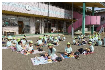
年長組 お外で給食を 食べたよ!