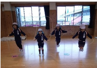
年少組 縄跳びの練習 頑張ってるよ!

四月六日(土) 入園式 (新幼少組のみとなります) 八日(月) 始業式 (新年長組と新年少組のみとなります) 九日(火)~十九日(金) 全園児登園 (半日保育) 二十二日(月) 一日保育開始 (給食が始まります)