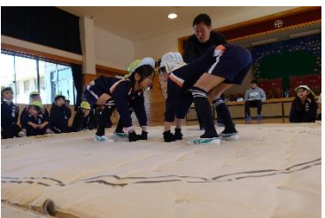
年長組 スポーツ大会(おすもう) はっけよーい のこった!